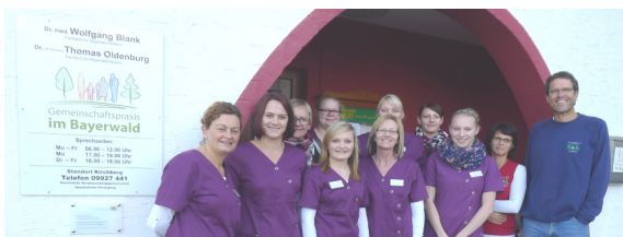
Das Praxisteam der Gemeinschaftspraxis im Bayerwald

Die neuen Indikatoren und Erhebungsinstrumente wurden in vier Praxen (u.a. Gemeinschaftspraxis im Bayerwald) pilotiert und bezüglich der Handhabbarkeit geprüft. Ab sofort werden die neuen Indikatoren in allen EPA-Hausarzt-Praxen angewendet.